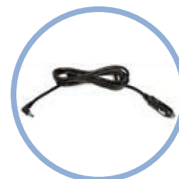
Cable de alimentación de CC del Inogen One G5* Modelo n.º BA-306