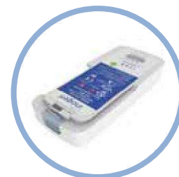
Batería de iones de litio del Inogen One G5* Hasta 6,5 horas de funcionamiento Modelo n.º BA-500