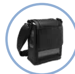
Bolsa portadora del Inogen One G5* Modelo n.º CA-500