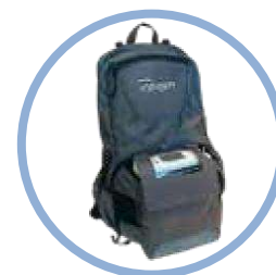
Mochila del Inogen One G5** Modelo n.º CA-550