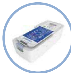
Batería de iones de litio de larga duración del Inogen One® G5 Hasta 13 horas de funcionamiento Modelo n.º BA-516